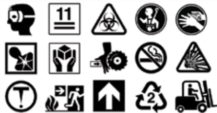
Más de 1.300 símbolos industriales