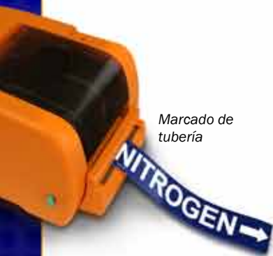
Marcado de tubería