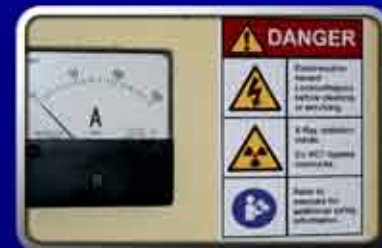
Múltiples Colores Personalizados