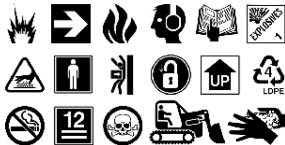
Más de 1.300 símbolos industriales comúnmente usados

¡Ahora Cerca a 50 Suministros Disponibles!