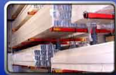
Etiquetado de Estantes