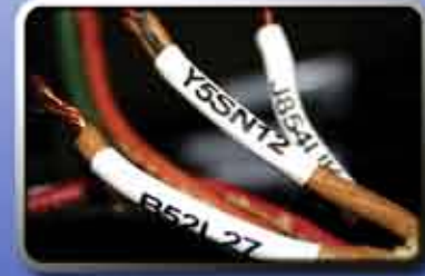
Marcado de Cables